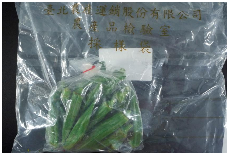
樣品照片 1 (背面)