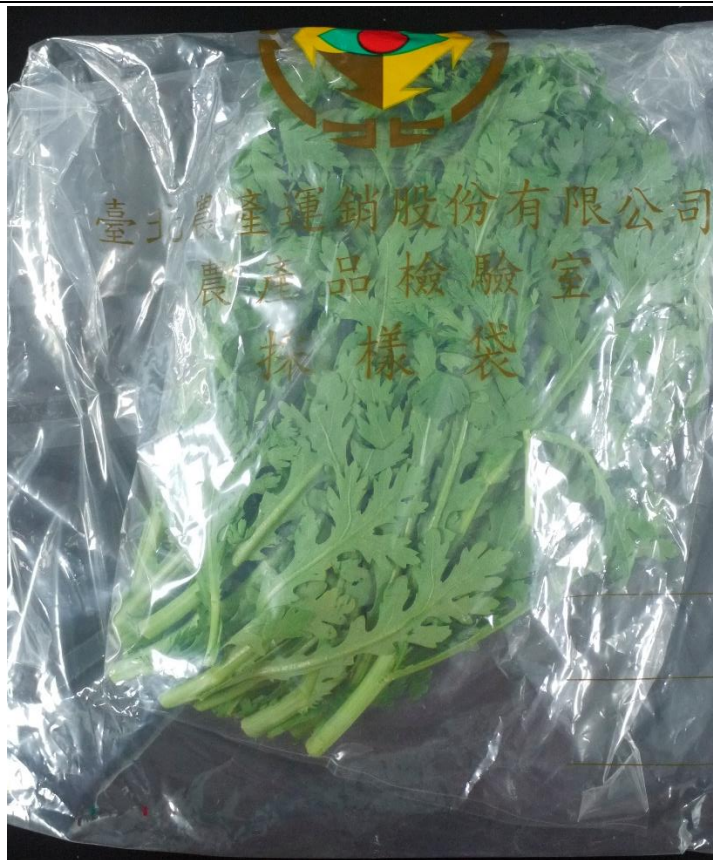
樣品照片 2 (正面)