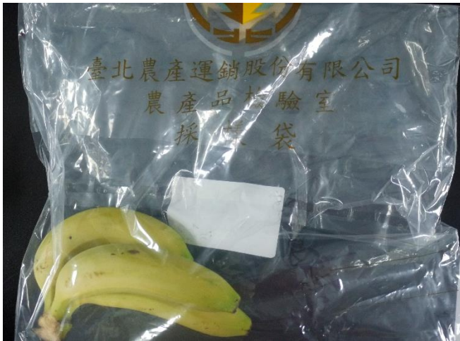
樣品照片 2 (正面)