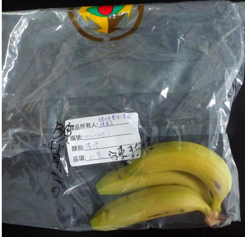
樣品照片 1 (背面)