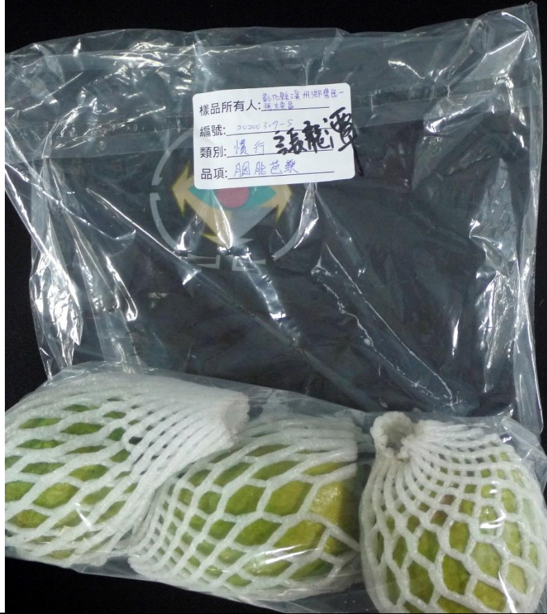
樣品照片 1 (背面)