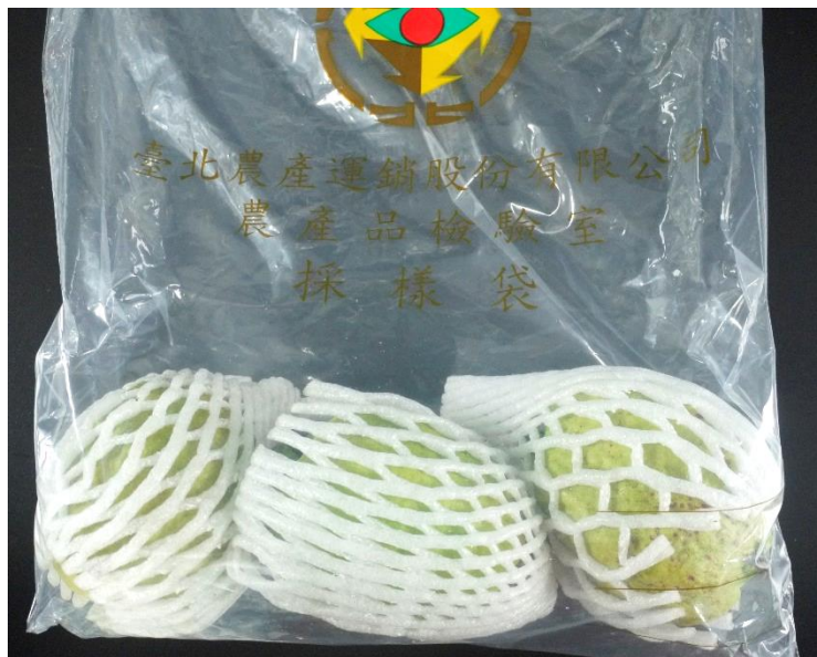
樣品照片 2 (正面)