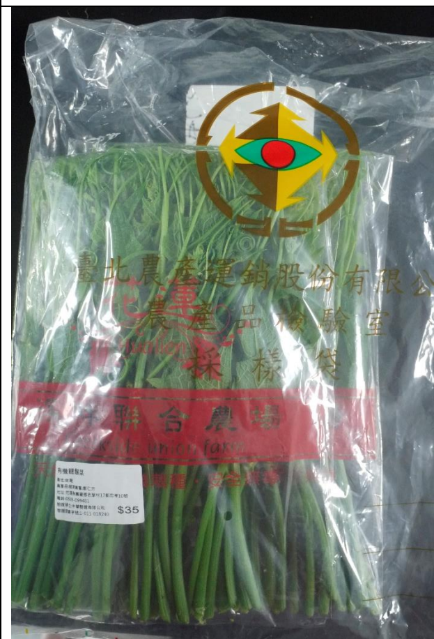
樣品照片 2 (正面)