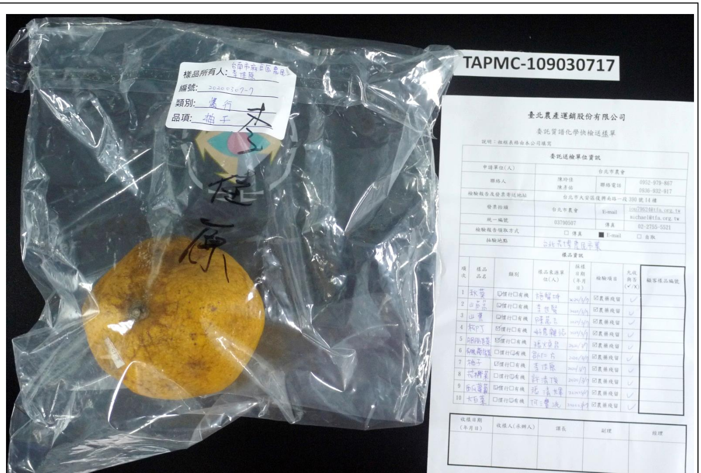
樣品照片 1 (背面)