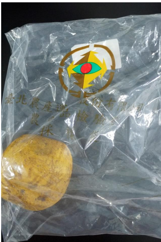
樣品照片 2 (正面)