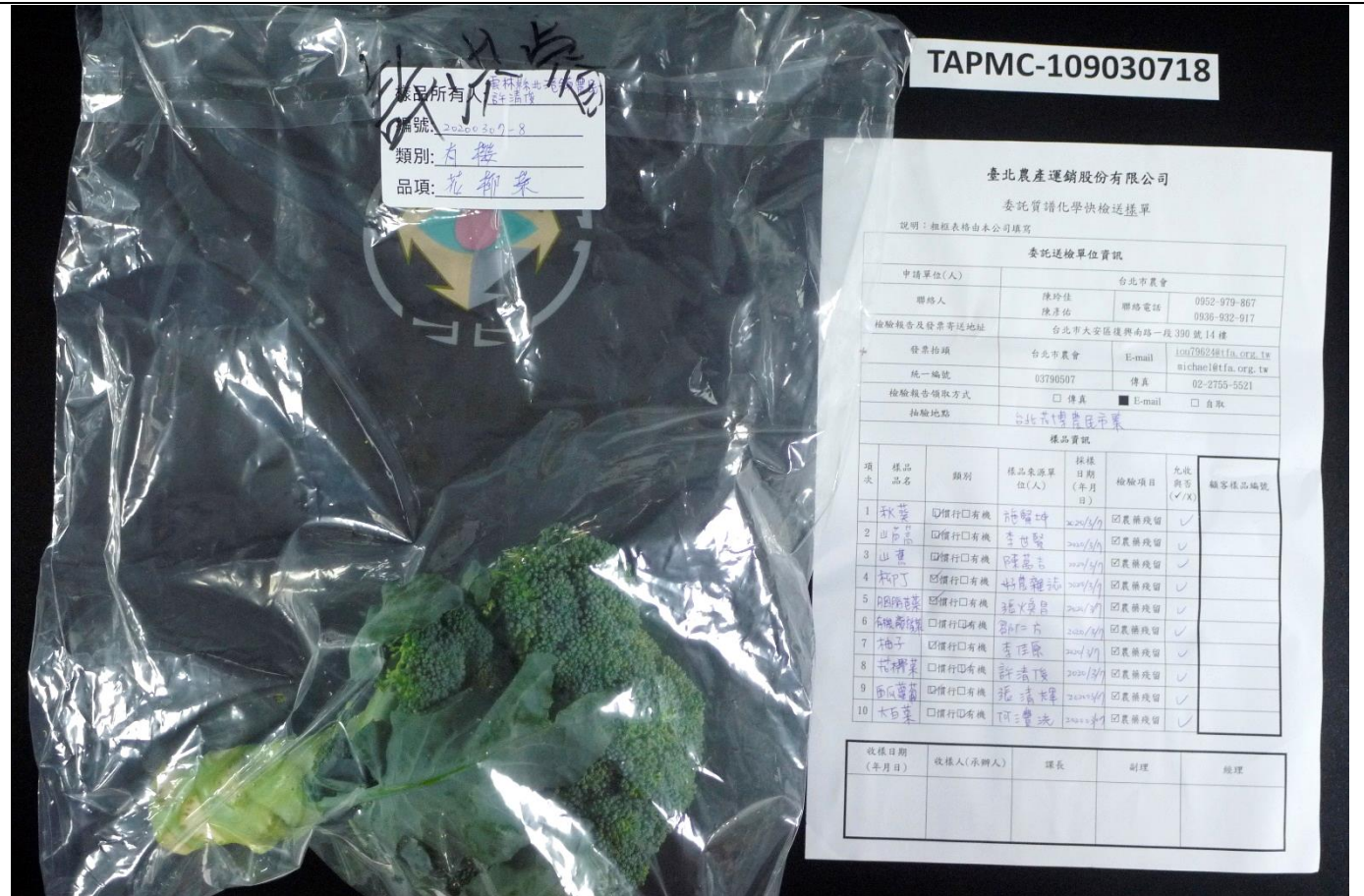
樣品照片 1 (背面)