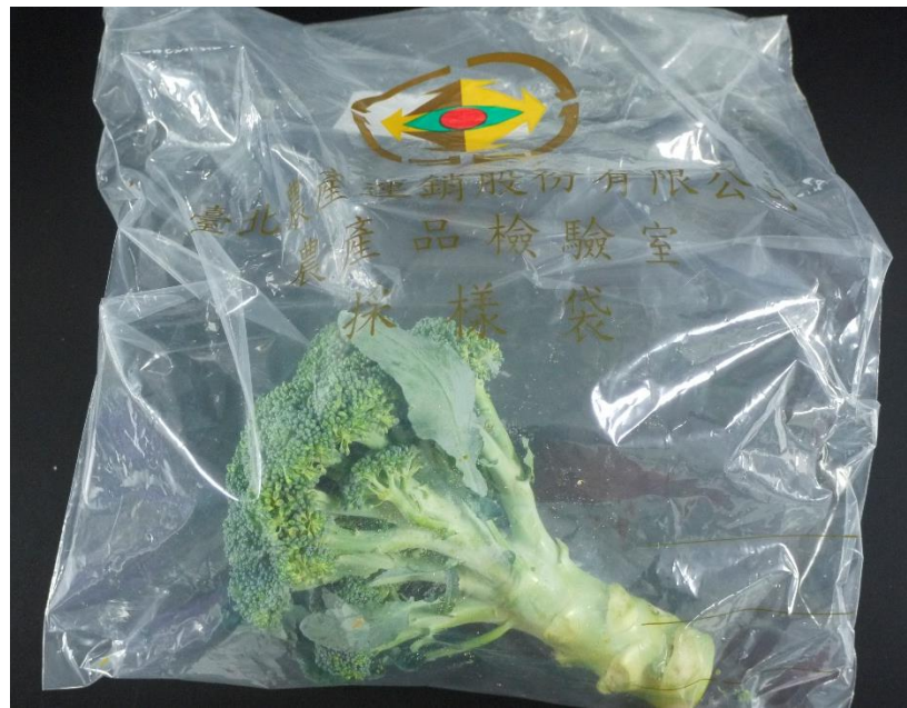
樣品照片 2 (正面)