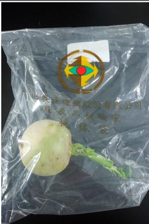
樣品照片 2 (正面)